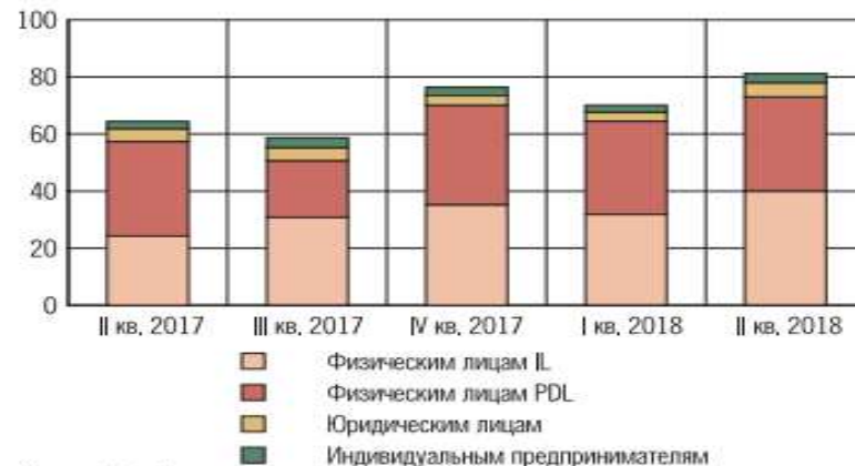
Динамика структуры выданных за квартал микрозаймов (млрд руб.)