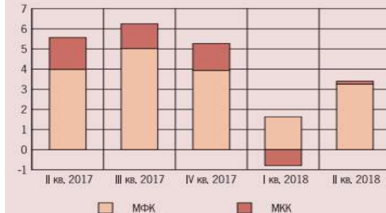
Динамика структуры чистой прибыли (млрд руб.)

3% участника рынка получили 95,7% совокупной прибыли за январь-июнь 2018 г.